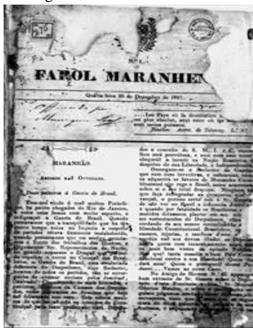
Imagem 2 - O Farol Maranhense